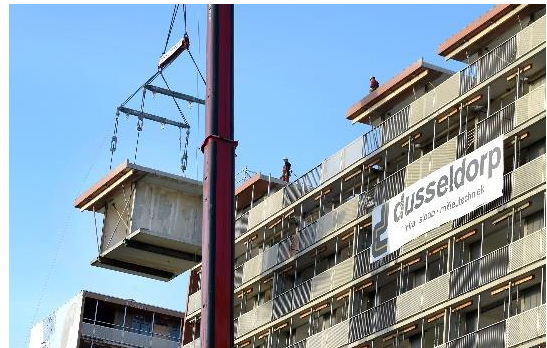
Het eerste uithijsmoment was in november 2017. Toen werden kleinere delen van appartementen uitgehesen.