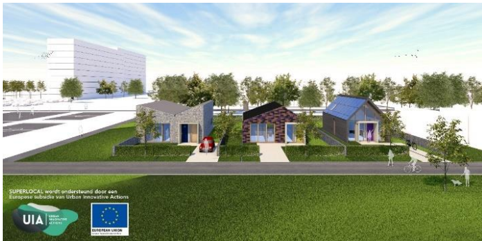
Een impressie van de drie proefwoningen die in de Ursulastraat komen.

In elke nieuwsbrief houden we u op de hoogte over alles wat er gebeurt in het project SUPERLOCAL bij u in de buurt. In deze nieuwsbrief gaan we in op een speciale mijlpaal op donderdag 9 mei! Ook vertellen we u wat meer over het vervolg van de bouw van de drie circulaire proefwoningen in de Ursulastraat.